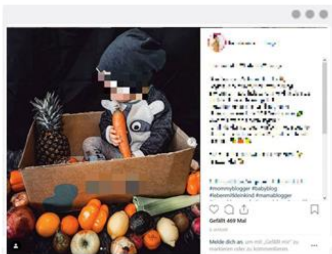
Kinder werden zu Werbezwecken instrumentalisiert.

Kinder werden im Zuge dessen zu Werbefiguren stilisiert, wobei Produkte wie Kindermode, Spielzeug, Kinderzimmerinterieur oder Kinderpflegeprodukte angepriesen werden. Teilweise wird der Nachwuchs aber auch für die Bewerbung von Produkten ohne expliziten Kinderkontext (z. B. Dekorations- und Einrichtungsgegenstände) regelrecht „drapiert“.