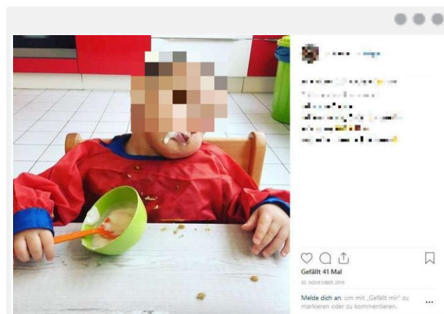
Momentaufnahmen, die Erwachsene amüsieren, können bei Kindern Schamgefühle hervorrufen.

Das Recht auf Selbstdarstellung, also auf die Entscheidung darüber, wie man sich nach außen präsentieren möchte, sieht jugendschutz.net in 22 % der Profile angetastet. Fotos von sabbernden, sich mit Essen bekleckern oder unbeabsichtigt komisch dreinblickenden Kindern mögen in Erwachsenenaugen süß oder witzig wirken, können bei den Betroffenen jedoch jetzt oder später erhebliche Schamgefühle hervorrufen. Schlimmstenfalls bieten sie sogar hinreichend Munition, um sie zur Zielscheibe für Spott und Häme zu machen.